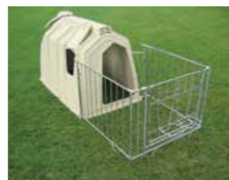
Recinzione Premium alta resistenza