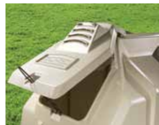
Completamente regolabile per la massima efficienza di aerazione