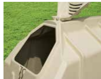
Lo sportello per l'inserimento della paglia da lettiera più grande nel suo genere