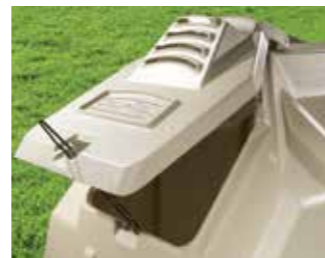
Completamente regolabile per la massima efficienza di aerazione