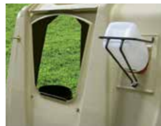
Opzione XXL disponibile per i modelli Pro e Deluxe